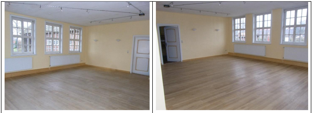
Die renovierten ehemaligen Klassenräume der Alten Schule Bütlingen

Doch zunächst der Blick zurück auf das fast abgelaufene Jahr 2015. Der Verein Alte Schule Bütlingen hat die ehemaligen Schul- und Klassenräume grundhaft modernisiert. Wand- und Malerarbeiten, sowie Heizungskörperertüchtigung und Fußbodengrundpflege sorgen für eine freundliche und gemütliche Umgebung für Ortsvereine, Gäste und Freunde der Alten Schule. Der Ausschuss für Bau-, Umwelt-, Energie- und Wege hat im Rahmen seiner Ortsbegehung am 7. September 2015 das Gebäude besichtigt. Kritisch wurde der Zustand der Anbauten im Außenbereich betrachtet. Lösungen zur Behebung des baufälligen Zustandes werden zurzeit leider nicht gesehen. Im Innenbereich wurde der gute Zustand der Räume, die der Verein betreut, registriert. Die Gemeinde Tespe ist kurz danach ihrer Rolle als Eigentümer fairerweise nachgekommen und hat sich angemessen an den Handwerkerkosten beteiligt.