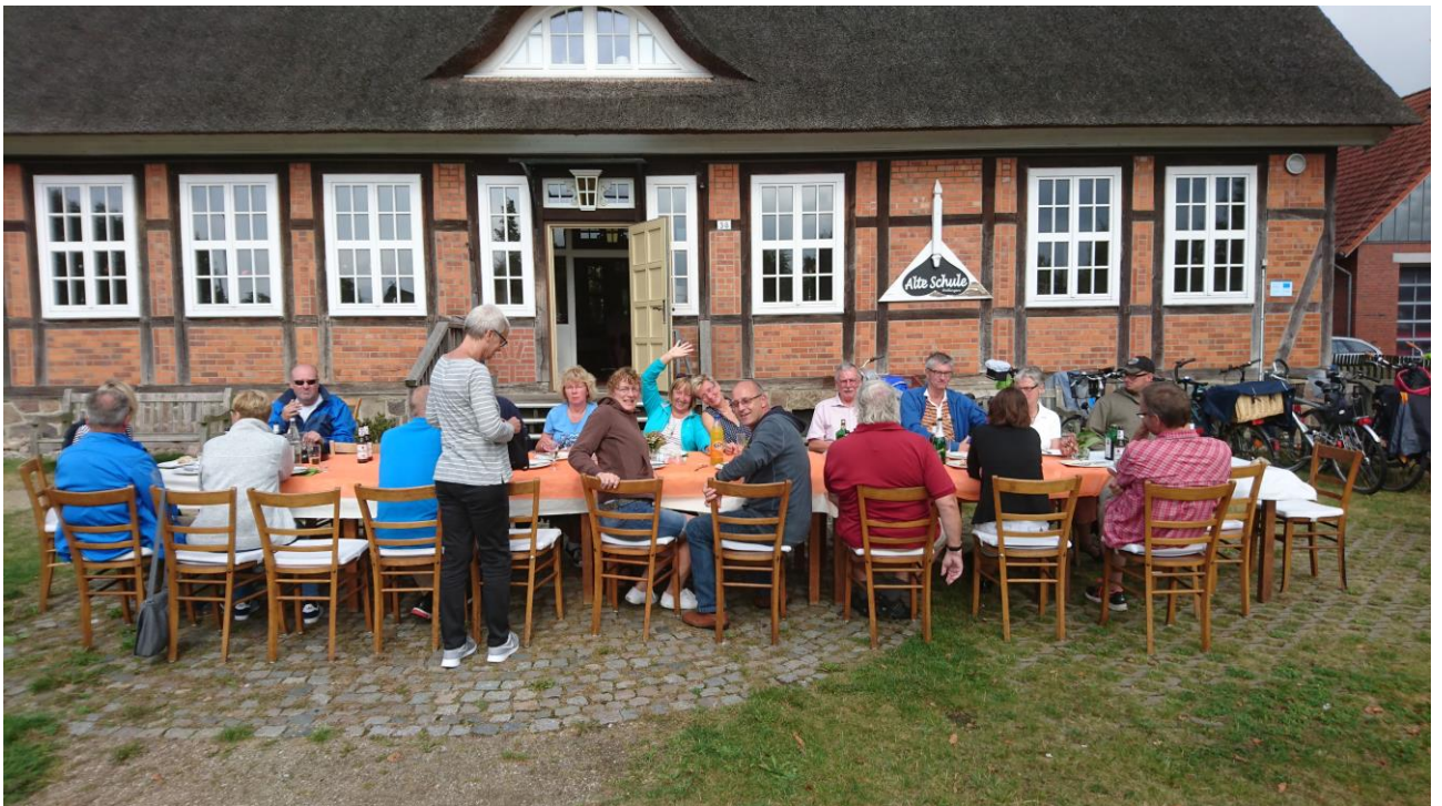
Radtour des Vereins Alte Schule Bötlingen: im September 2016 durch die Elbmarsch