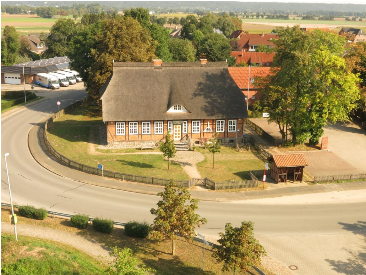
Dorfgemeinschaftshaus Alte Schule Bütlingen im Jahr 2016