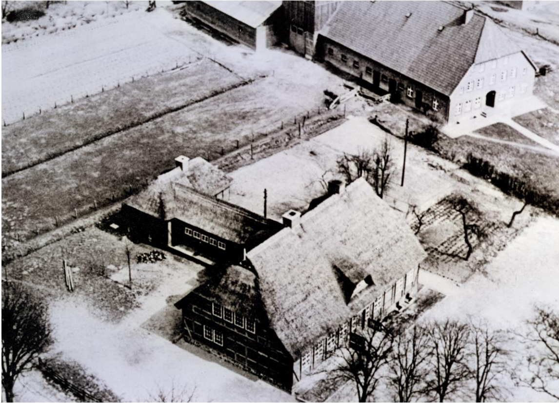
Das alte Schulhaus in Bütlingen (Luftbild aus dem Jahr 1956)