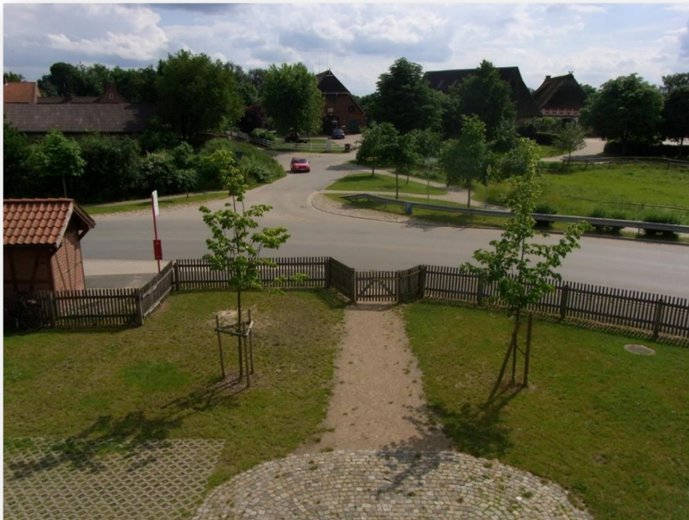
Mittelpunkt des alten Dorfes in der Elbmarsch