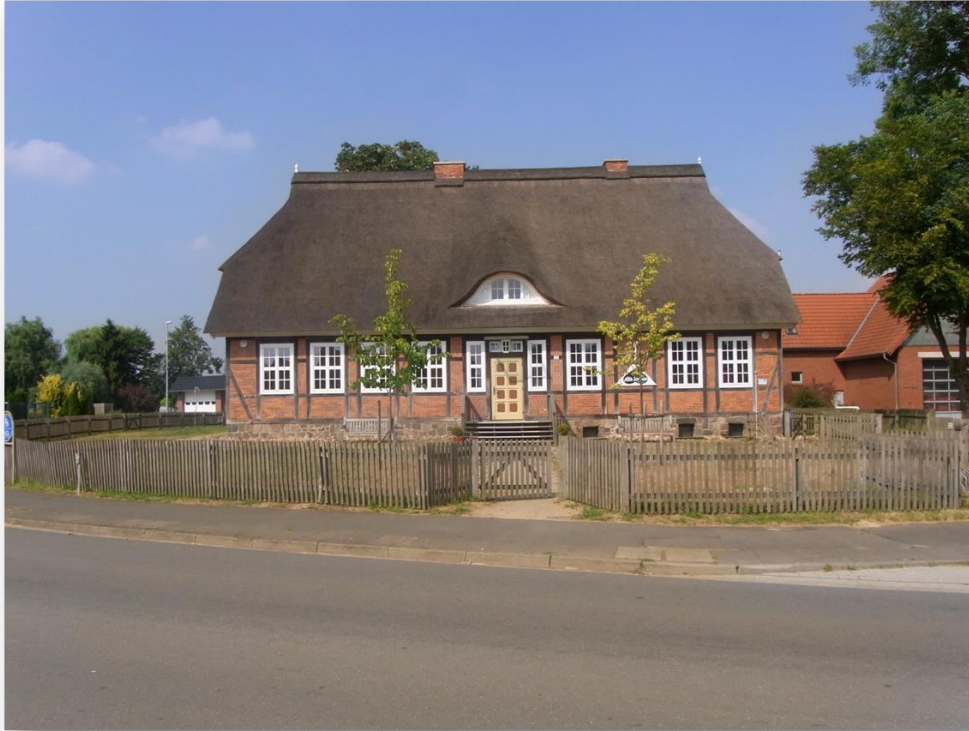
Dorfgemeinschaftshaus Alte Schule Bütlingen