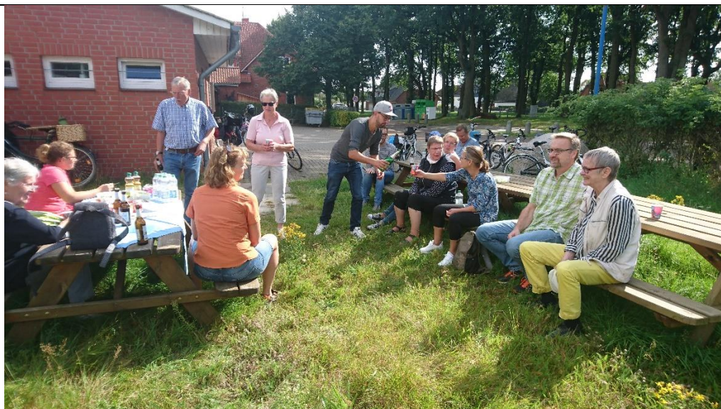
Radtour des Vereins im September 2017