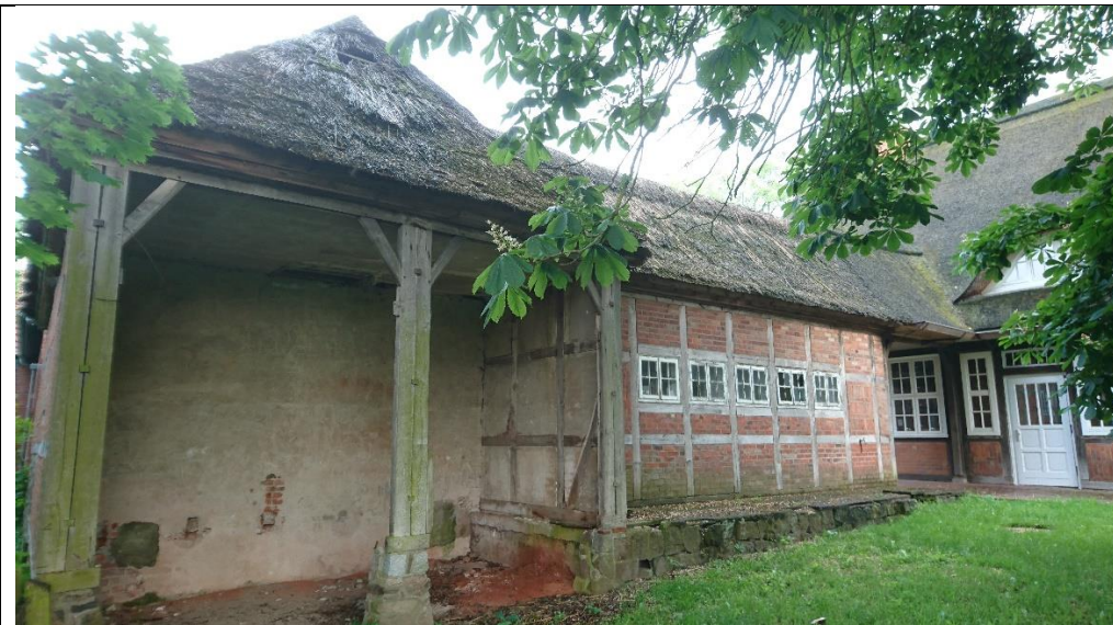
Anbau der alten Schule Bütlingen