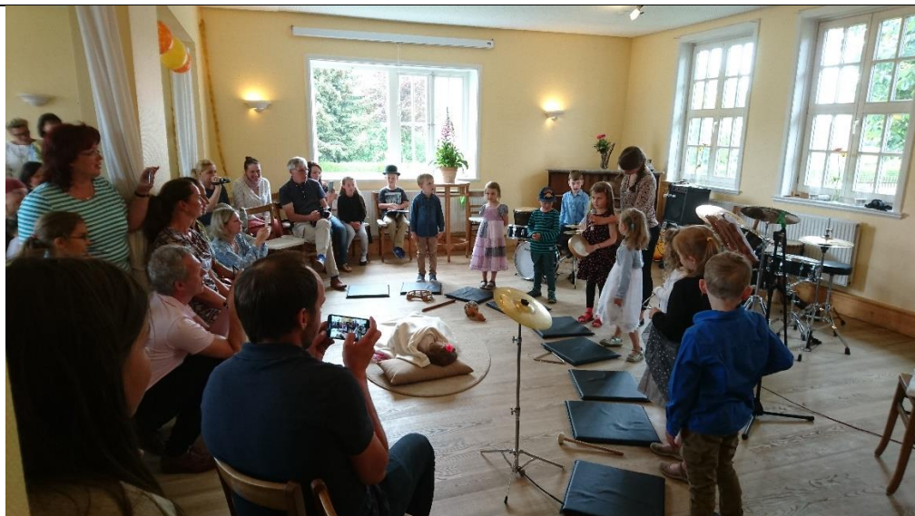
Aufführung der Musikschule Marschacht